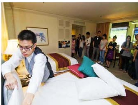
綜合職業訓練中心