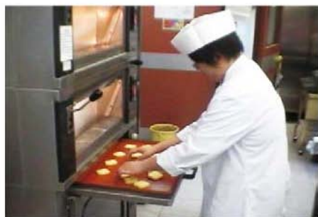
職業訓練局：展亮技能發展中心