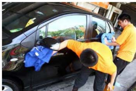
綜合職業康復服務中心