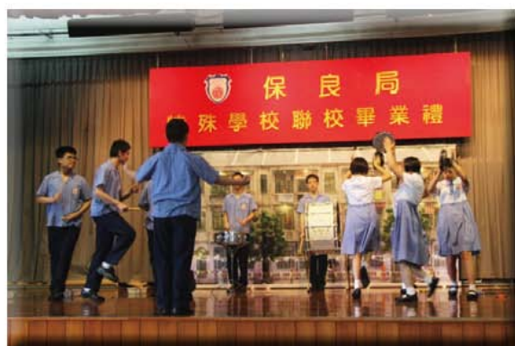
學生樂器表演： 土耳其進行曲